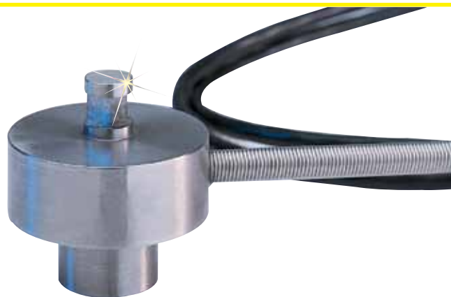
TQ201-100, 图中所示为实际尺寸。

输出: 2 mV/V 激励: 10 Vdc, 最大值为15V 输入电阻: 最小350 Ω 输出电阻: 最小350 Ω 精度等级: ±0.2% FSO 线性度: ±0.15% FSO 滞后性: ±0.10% FSO 重复性: ±0.03% FSO 零点平衡: ±2% FSO 工作温度范围: -54~ 107°C (-65 ~ 225°F) 补偿温度范围: 16~ 71°C (60 ~ 160°F) 热效应: 零点: ±0.005% FSO/°F 跨距: 读数的±0.005%/°F 安全过载: 容量的150% 极限过载: 容量的300% 结构: 不锈钢 保护等级: IP65 电气: 1.5 m (5') 4芯PVC屏蔽电缆 (带有耐扭电缆固定头)